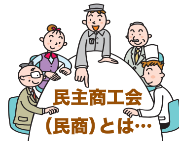
民主商工会 (民商)とは…

さまざまな業種の自営商工業者でつくる組織で、中小業者の権利を守り、経済的、社会的地位の向上をめざして運動を進めています。全ての都道府県に連合会があり、上尾・伊奈地域で350人、全国では20万人の業者が加入しています。